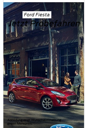
Abbildung zeigt Wunschausstattung gegen Mehrpreis.

Autozentrum Biedenkopf Acker GmbH & Co. KG