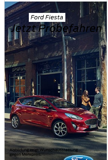
Abbildung zeigt Wunschausstattung gegen Mehrpreis.

Autozentrum Biedenkopf Acker GmbH & Co. KG